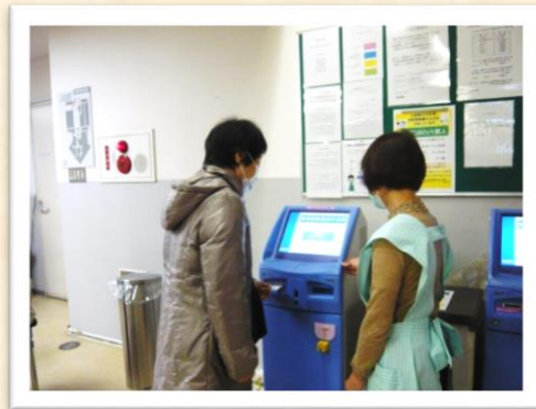
(患者さんにいつも親切、頼りにされています！:外来部)